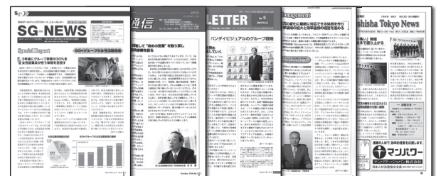
弊社制作のニュースレターは、(社)日本パブリックリレーションズ協会主催の「PRアワードグランプリ」で優秀賞を受賞しています。